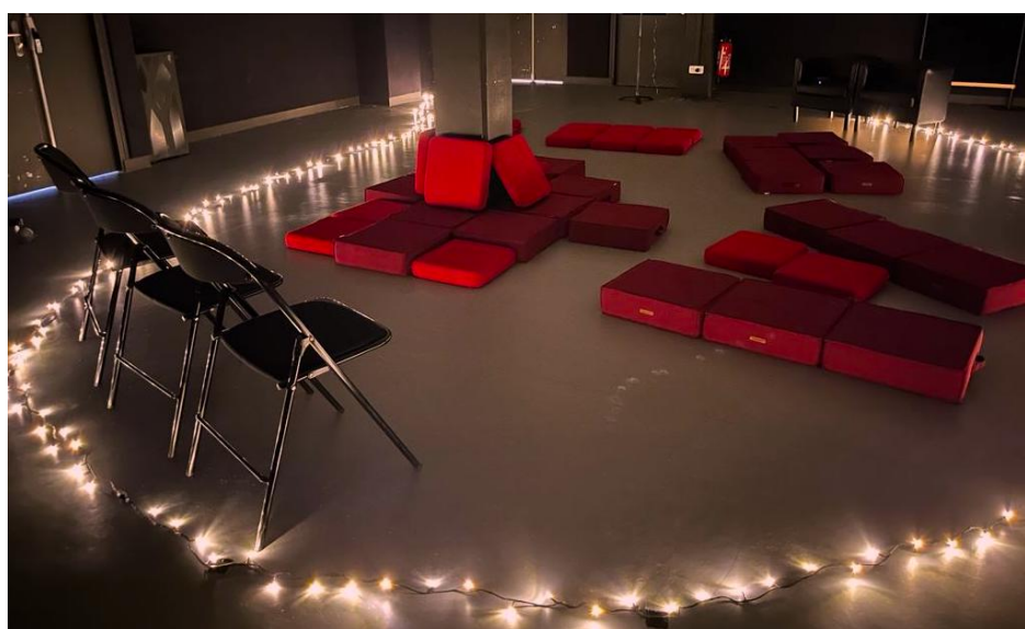
Le dispositif du « cocon sonore », salle Boris Vian, bibliothèque Robert Desnos de Montreuil (93).

une certaine intimité avec soi-même tout en partageant cet espace commun que nous appellerons cocon.